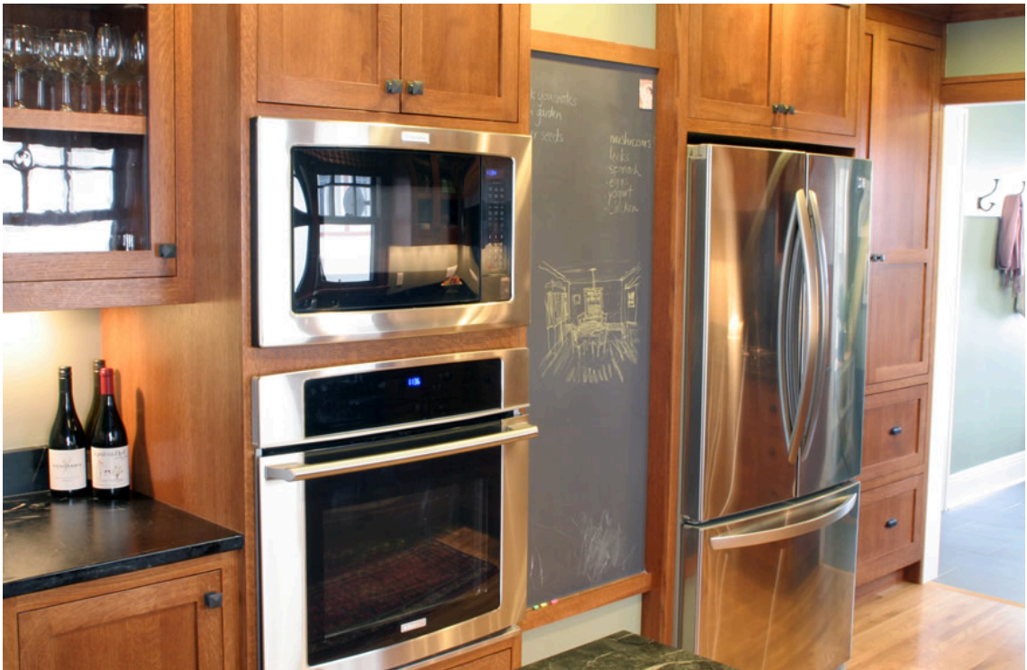
Cocina Remodelada 1