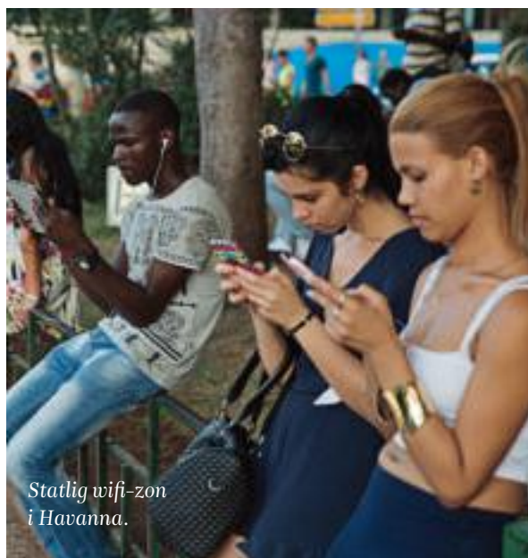
Statlig wifi-zon i Havanna.

*När intervjuerna till detta reportage gjordes på Kuba var konstnären Danilo Maldonado Machado gripen. Han släpptes den 21 januari i år.