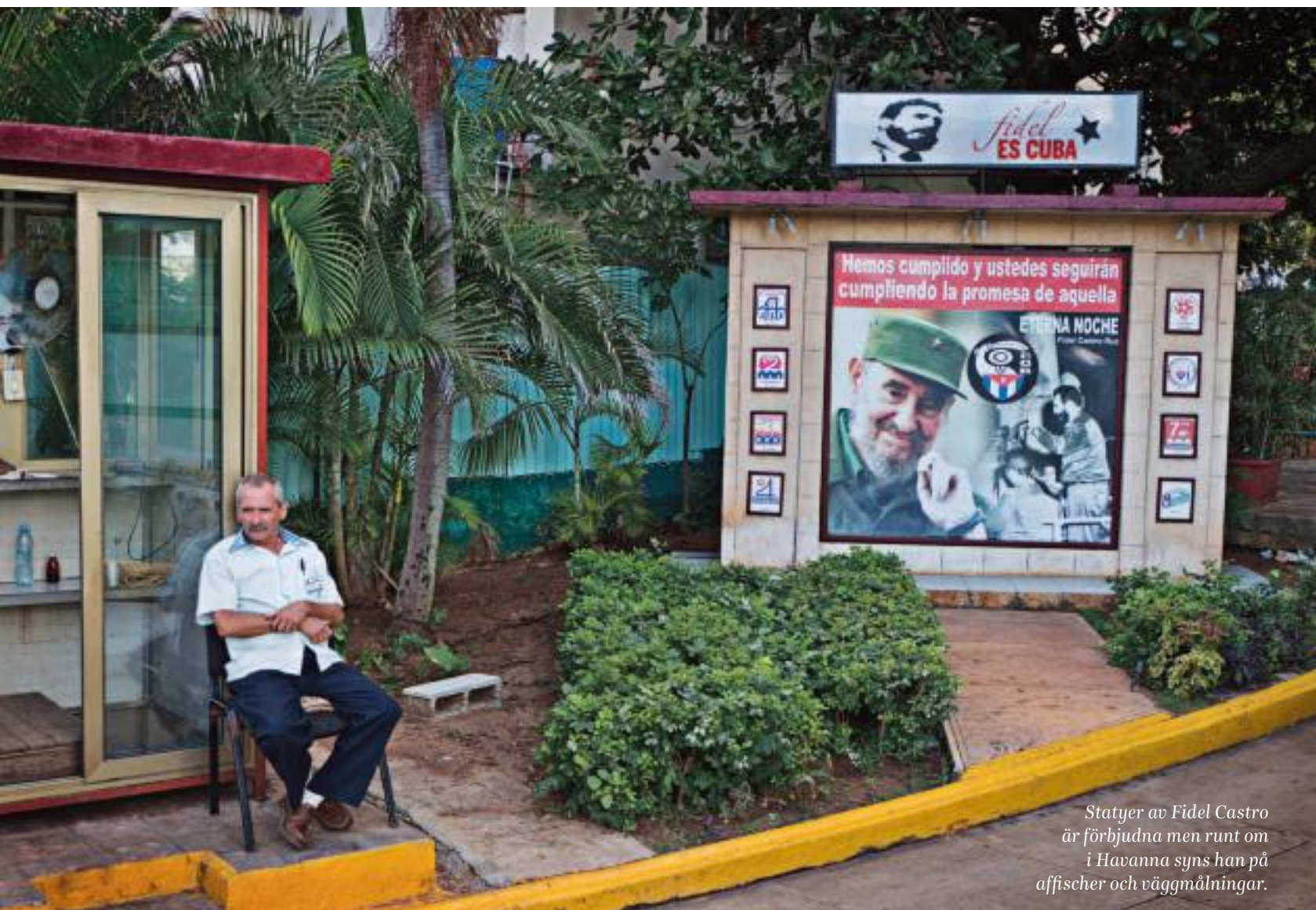
Statyer av Fidel Castro är förbjudna men runt om i Havanna syns han på affischer och väggmålningar.