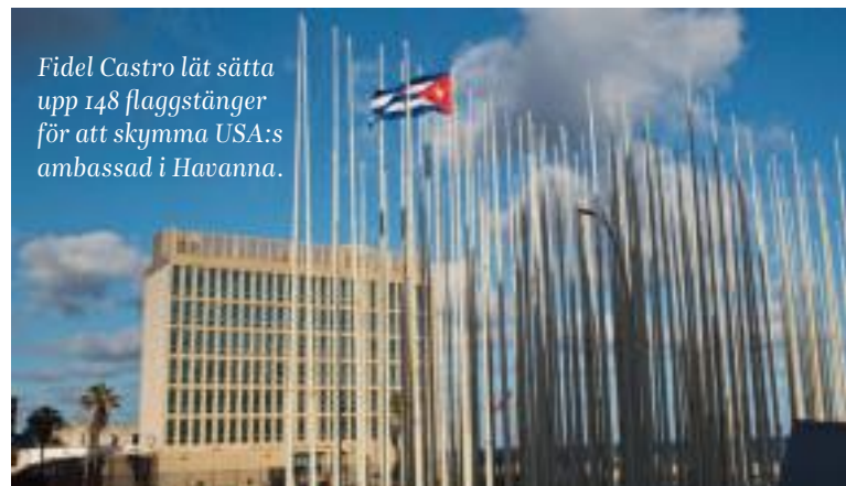
Fidel Castro lät sätta upp 148 flaggstänger för att skymma USA:s ambassad i Havanna.

I EN LÄGENHET i Miramar driver Carlos Garaicoa ett projekt som fungerar som en brygga mellan de olika generationerna av kubanska