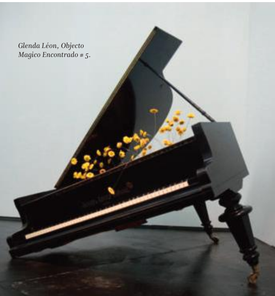
Glenda León, Objecto Magico Encontrado # 5 .