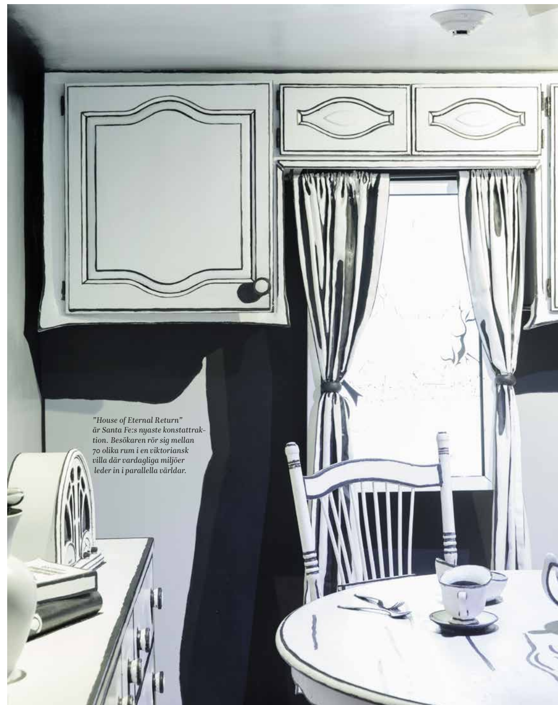
"House of Eternal Return" är Santa Fe:s nyaste konstattraktion. Besökaren rör sig mellan 70 olika rum i en viktoriansk villa där vardagliga miljöer leder in i parallella världar.

På 1960- och 1970-talen blev staden ett dragplåster för unga människor som sökte motkultur och alternativa livsstilar. Folkbusslaster med hippies, beatniks, miljökämpar och fredsakti-