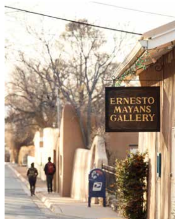
Canyon Road, stadens största gallerigata, är som en ständigt pågående konstmässa.

SANTA FE ÄR en av USA:s äldsta städer, grundad 1610 av spanska kolonistörer på en högplatå mitt i New Mexicos ökenlandskap, omringad av bergskedjan Sangre de Cristo. Staden har unik arkitektur, med låga jordfärgade rundade hus, byggda av adobe; en blandning av soltorkad lera och halm. Att Santa Fe ser ut så beror på en hundraårig målmedveten plan att locka konstnärer och kulturtravister. Det började med konkurrens från grannstaden Taos, som på 1910-talet blivit en viktig kulturstad. Konstnärer från USA:s östkust reste dit på somrarna och skildrade landskapet och den amerikanska ursprungsbefolkning som bott i området i tusentals år. Samtidigt var Santa Fe fortfarande bara en dammig avkrok. Stadsledningen ville ändra på saken och satsa på den lokala kulturen, med dess blandning av spanskt och ursprungsamerikanskt