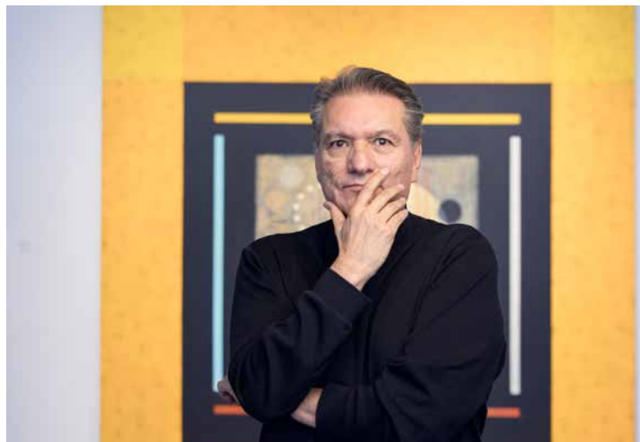
Dan Namingha är en av de mest tongivande konstnärerna från den amerikanska ursprungsbefolkningen.