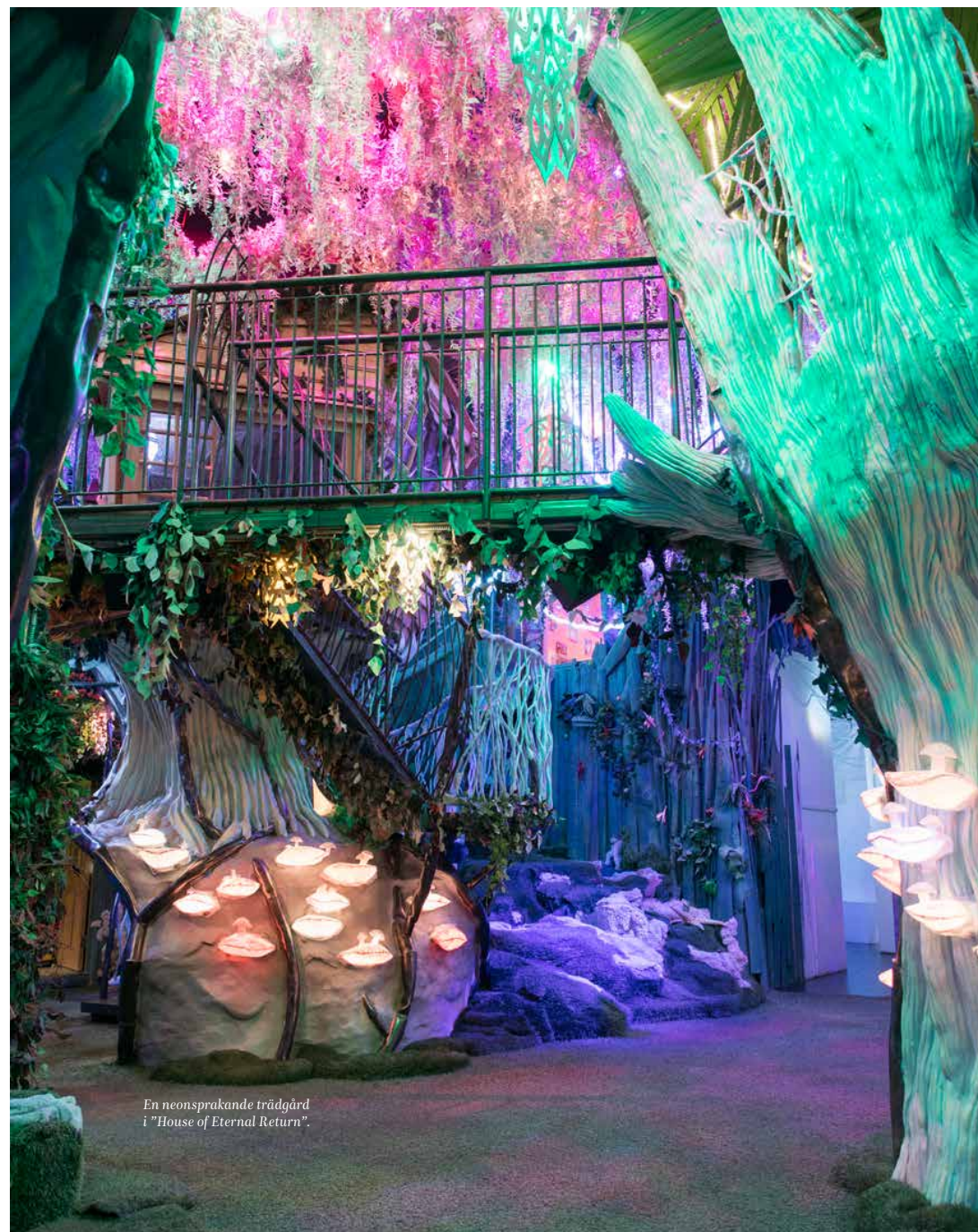
En neonsprakande trädgård i "House of Eternal Return".