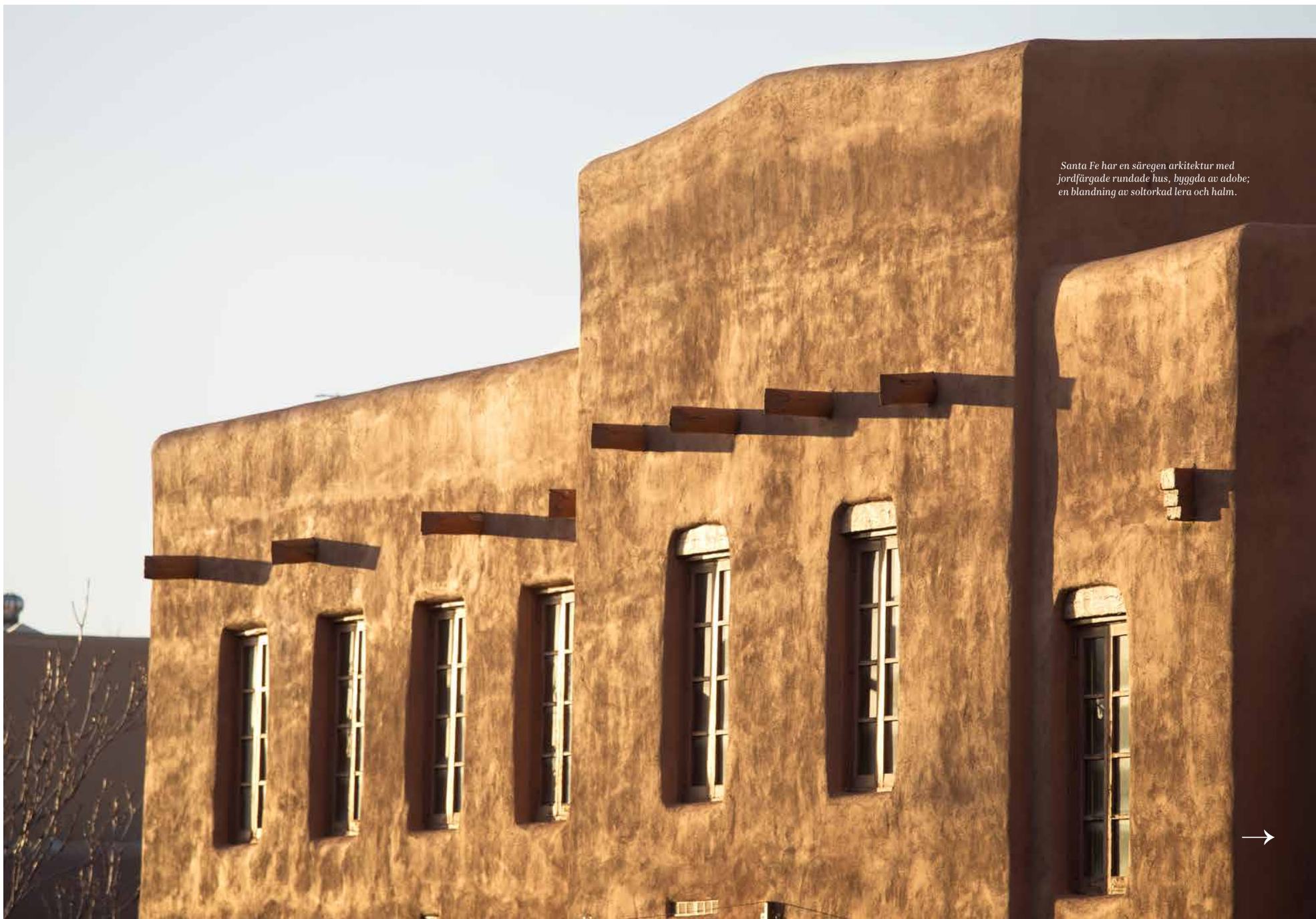
Santa Fe har en säregen arkitektur med jordfärgade rundade hus, byggda av adobe; en blandning av soltorkad lera och halm.

New Mexico Museum of Art Öppnade 1917 och var en viktig del i att göra Santa Fe till en konststad. En av stadens mest kända adobebyggnader.