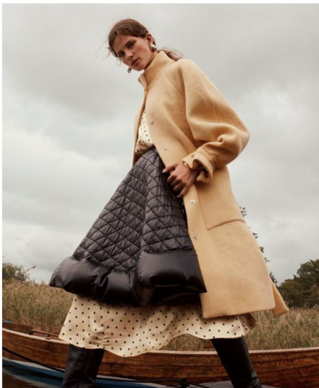
Kjole og kåpe: Stine Goya – Skjørt: Moncler/Yme Universe – Sko: Vagabond – Øreringer: All Blues/Yme Universe