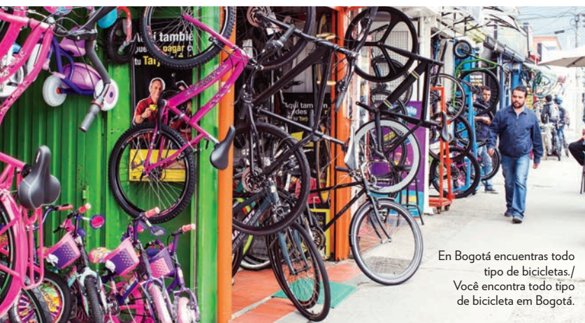
En Bogotá encuentras todo tipo de bicicletas. / Você encontra todo tipo de bicicleta em Bogotá.

Para venir aquí, empacamos nuestras bien-usadas bicicletas en cajas para el viaje a Bogotá. Metimos todos lo que necesitábamos en bolsas a prueba de agua que colgamos de los marcos de las bicicletas; e íbamos cargados de carpas, sleeping bags y ropa. Nuestro equipaje nos serviría para noches frías a más de 4.000 metros de altura, y para días calurosos y soleados en el Valle del Cauca.