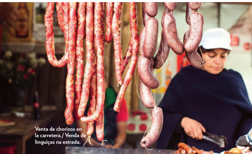
Venta de chorizos en la carretera. / Venda de linguiças na estrada.

Explicaram a ela que tinham voado para a França vindos das florestas de Caquetá e que ver ao vivo o maior ciclista da Colômbia era um sonho para eles. “Lá por 2014, nós o ouvíamos na floresta. Ouvíamos pelas ondas curtas Nairo ganhar uma etapa. E nos prometemos que, se algum dia saíssemos do país, >