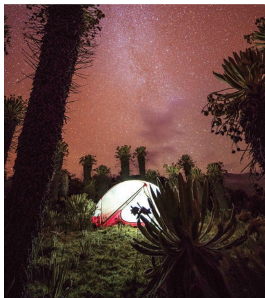
Un campamento entre los frailejones del páramo./ Um acampamento entre os frailejones do platô.

Parece que o futuro é brilhante para o ciclismo colombiano. “A geração atual é de atletas maravilhosos”, diz Rendell. “Mas é apenas o começo do que está por vir”. NX