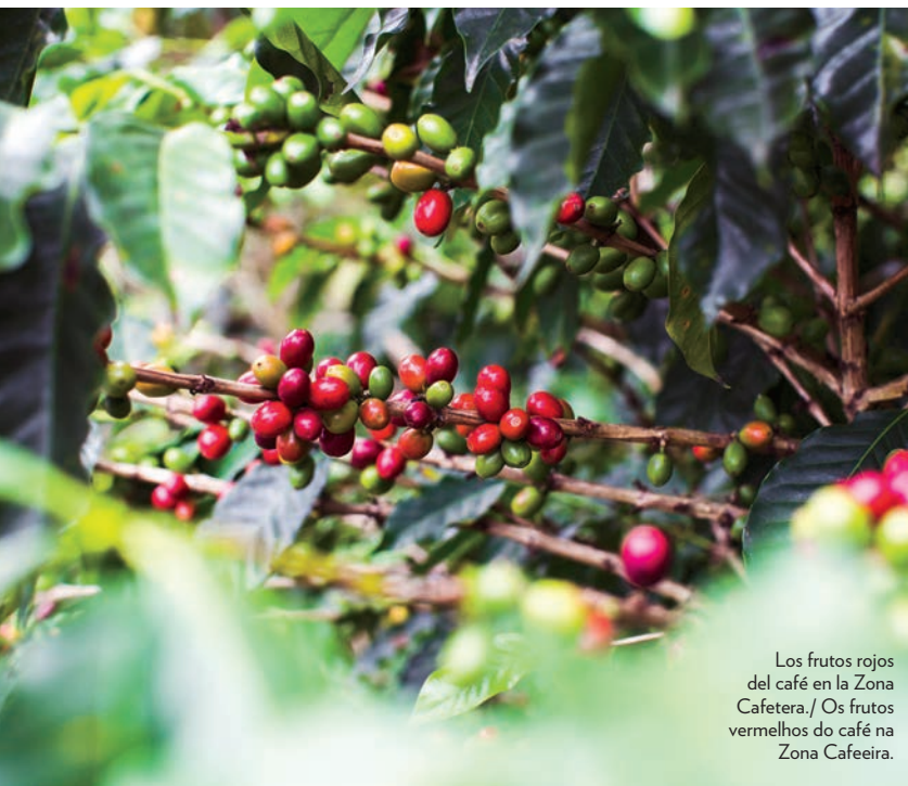
Los frutos rojos del café en la Zona Cafetera. / Os frutos vermelhos do café na Zona Cafeeira.