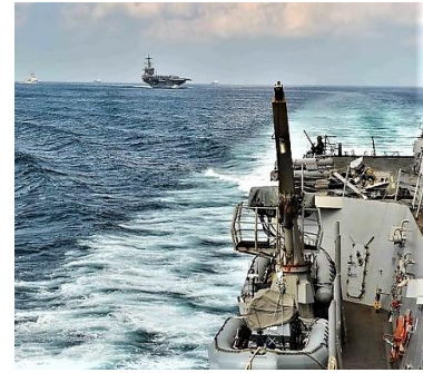
Farragut & Lincoln, Hormus 181219 USCC

Ankara reagierte offenbar damit auf die Senats-Resolution 150 zum Armenischen Genozid vom 12. Dezember. Der Text bestätigt den Genozid an etwa 1,5 Mio. Armeniern im Osmanenreich 1915-1923 und benennt weitere Opfergruppen wie Griechen, Assyrer, Chaldäer, Aramäer und Maroniten. Wie in der Haus-Resolution zuvor, fehlt hier der versuchte Genozid an Palästinas Juden 1915-17. US-Politik wird, des Armenischen Genozids zu gedenken.