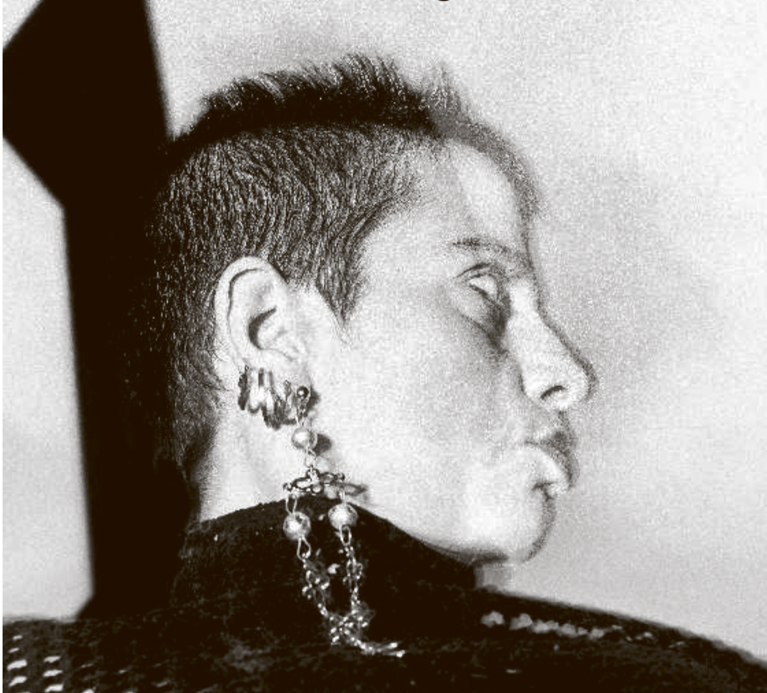
Den amerikanske forfatter Kathy Acker (1947-1997).