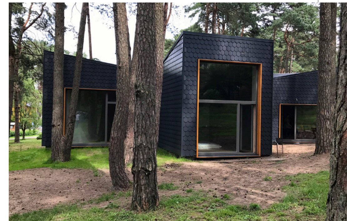
▲ Individualus gyvenamasis namas Kačerginėje (2018 m.), projekto architektas – Gintaras Balčytis.

Ir galiausiai – tai turi būti architektūros meno kūrinys.